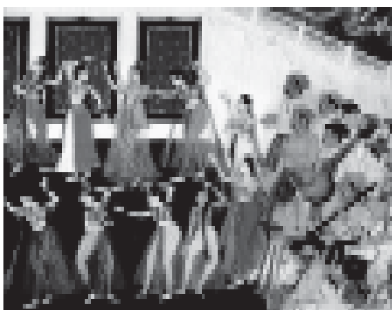
चित्र 9.11 (ग)

➡ चित्र में आप जो देख रहे हैं उसका वर्णन कीजिए।