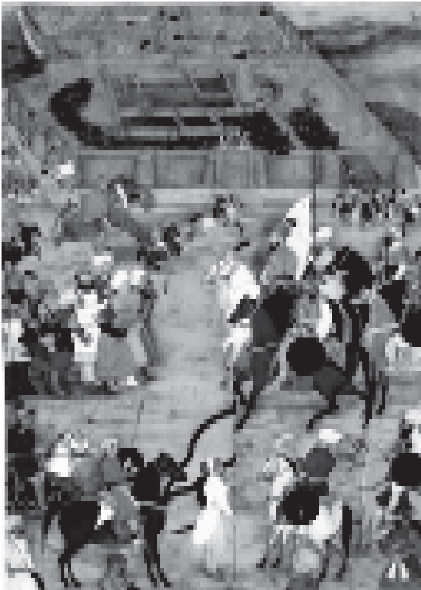
चित्र 9.15 कंधार की घेराबंदी

कंधार सफ़ावियों और मुगलों के बीच झगड़े की जड़ था। यह किला-नगर आरंभ में हुमायूँ के अधिकार में था जिसे 1595 में अकबर द्वारा पुनः जीत लिया गया। यद्यपि सफ़ावी दरबार ने मुगलों के साथ अपने राजनयिक संबंध बनाए रखे तथापि कंधार पर यह दावा करता रहा। 1613 में जहाँगीर ने शाह