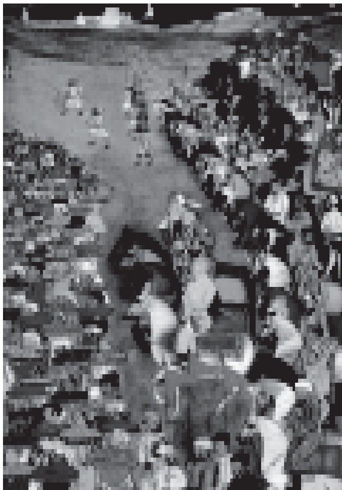
चित्र 9.11 (क) दाराशिकोह का विवाह