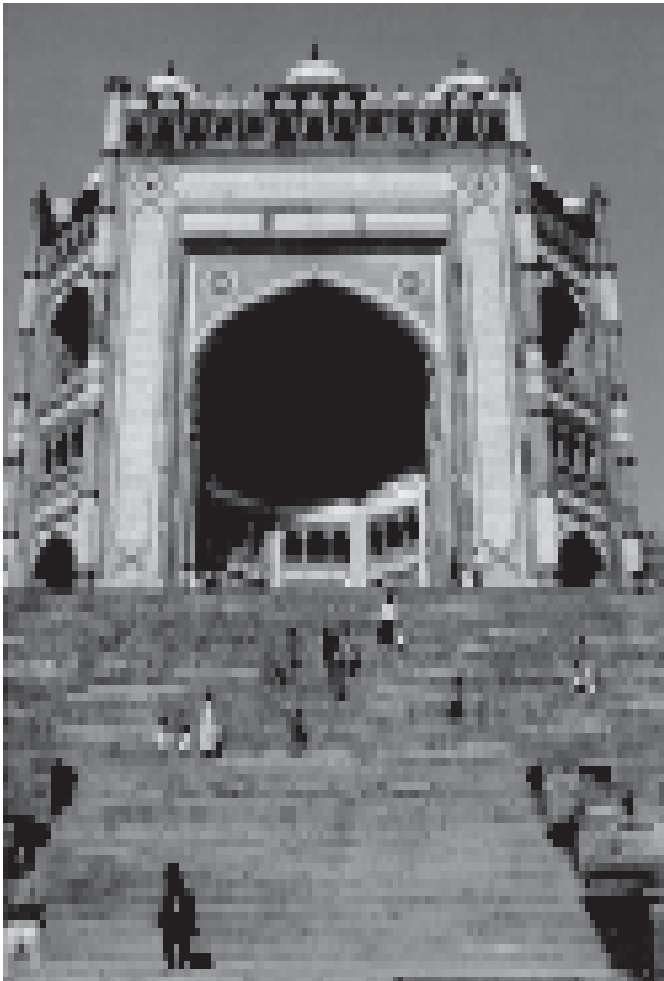
चित्र 9.8 बुलंद दरवाज़ा, फतेहपुर सीकरी

1648 में दरबार, सेना व राजसी खानदान आगरा से नयी निर्मित शाही राजधानी शाहजहाँनाबाद चले गए। दिल्ली के प्राचीन रिहायशी नगर में शाहजहाँनाबाद एक नयी और शाही आबादी थी। यहाँ लाल किला,