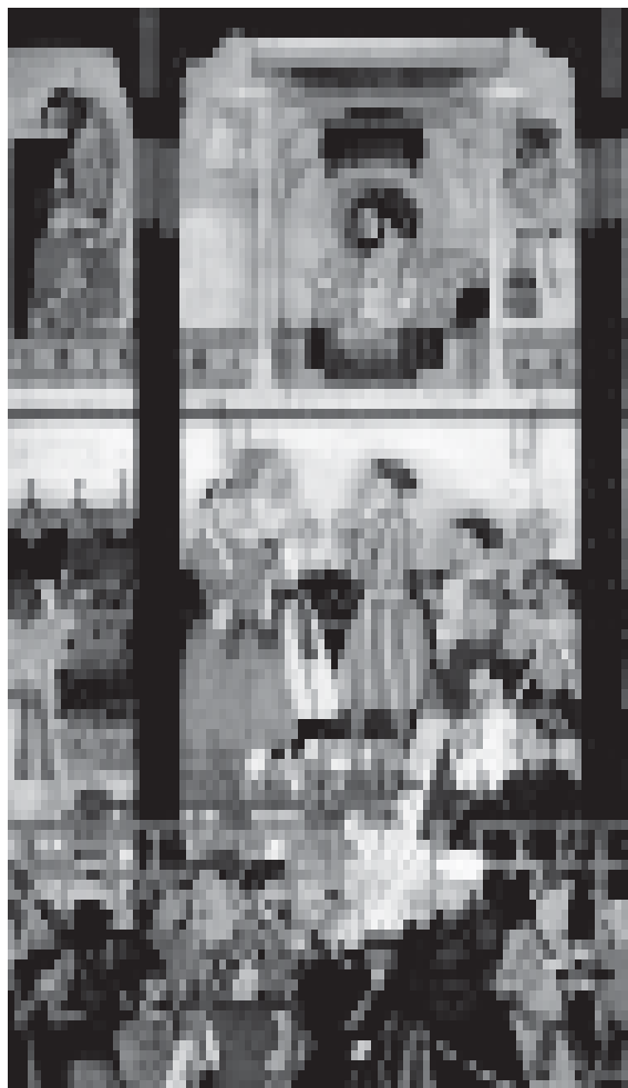
चित्र 9.11 (ख)