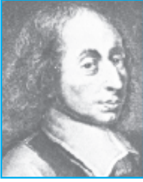
ब्लेज पास्कल (1623–1662) आकृति 15.1

पिछली कक्षाओं में आप प्रायिकता का आभास कुछ प्रयोग जैसे सिक्के उछालना, पासा फेंकना आदि में कर चुके हैं और उनके परिणाम (outcome) देख चुके हैं। अब आप देखेंगे कि एक प्रयोग में एक विशेष परिणाम के घटने का संयोग (chance) किस प्रकार मापा जाता है।