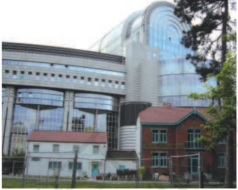
बेल्जियम में स्थित यूरोपीय संघ की संसद

आपको बेल्जियम का मॉडल कुछ जटिल लग सकता है। निश्चित रूप से यह जटिल है—खुद बेल्जियम में रहने वालों के लिए भी। पर यह व्यवस्था बेहद सफल रही है। इससे मुल्क में गृहयुद्ध की आशंकाओं पर विराम लग गया है वरना गृहयुद्ध की स्थिति में बेल्जियम भाषा के आधार पर दो टुकड़ों में बँट गया होता। जब अनेक यूरोपीय देशों ने साथ मिलकर यूरोपीय संघ बनाने का