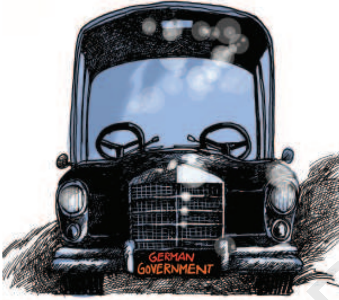
जर्मन इंजीनियरिंग का बेहतरीन नमूना...