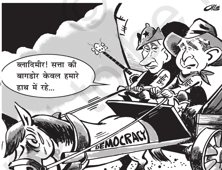
सत्ता की बागडोर

ऑले जॉनसन-स्वीडन, केगल कार्टून, 25 फरवरी 2005