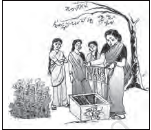
चित्र 6.5 ग्रामीण परिवार में महिलाएँ मधुमक्खी पालन को एक उद्यम क्रिया के रूप में ले सकती हैं

उद्यान विज्ञान ( बागवानी ): प्रकृति ने भारत को ऋतुओं और मृदा की विविधता से संपन्न