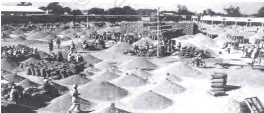
चित्र 6.1 नियमित अनाज मंडियाँ किसानों और उपभोक्ताओं को लाभ पहुँचाती हैं

कभी आपने सोचा है, कि हम जो अनाज, फल सब्जियाँ आदि रोज खाते हैं वे देश के अलग-अलग क्षेत्रों से किस प्रकार नियमित रूप से हम तक पहुँचाये जाते हैं? इन्हें हम तक पहुँचाने का माध्यम बाजार व्यवस्था है। कृषि विपणन वह प्रक्रिया है जिससे देश भर में उत्पादित कृषि पदार्थों का संग्रह, भंडारण, प्रसंस्करण, परिवहन, पैकिंग, वर्गीकरण और वितरण आदि किया जाता है।