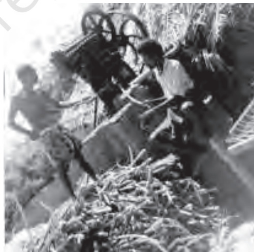
चित्र 6.2 गुड़ निर्माण कृषि क्षेत्रों का एक संबद्ध क्रियाकलाप है

विविधीकरण के दो पहलू हैं: एक पहलू तो फसलों के उत्पादन की प्रणाली में परिवर्तन से संबंधित है। दूसरा पहलू श्रम शक्ति को खेती से हटाकर अन्य संबंधित कार्यों (जैसे पशुपालन, मुर्गी और मत्स्य पालन आदि) तथा गैर-कृषि क्षेत्रों में लगाना है। इस विविधीकरण की आवश्यकता इसलिए उत्पन्न हो रही है, क्योंकि सिर्फ खेती के आधार पर आजीविका कमाने में जोखिम बहुत अधिक हो जाता है। अतः विविधीकरण द्वारा हम न केवल खेती से जोखिम को कम करने में सफल होंगे बल्कि ग्रामीण जन समुदाय को उत्पादक और वैकल्पिक धारणीय आजीविका के अवसर भी उपलब्ध हो पाएँगे। देश में अधिकांश