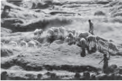
चित्र 6.3 ग्रामीण क्षेत्रों में भेड़ पालन आय वृद्धि का महत्वपूर्ण स्रोत है

आदि। यद्यपि, अधिकांश ग्रामीण महिलाएँ कृषि में रोजगार प्राप्त करती हैं, जबकि पुरुष गैर-कृषि रोजगार की तलाश में हैं। किंतु, हाल के वर्षों में ग्रामीण महिलाएँ भी गैर कृषि कार्यों की ओर अग्रसर होने लगी हैं (देखें बॉक्स 6.2)।