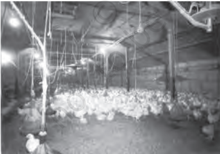
चित्र 6.4 भारत में मुर्गी पालन का पशुधन में सबसे अधिक भाग है

किया है। उसी के आधार पर भारत ने अनेक प्रकार के बागान उत्पादों को अपना लिया है। इनमें प्रमुख हैं – फल-सब्जियाँ, रेशेदार फसलें, औषधीय तथा सुगंधित पौधे, मसाले, चाय, कॉफी इत्यादि। ये सभी फसलें रोजगार के साथ-साथ भोजन और पोषण उपलब्ध कराने में भी बड़ा योगदान दे रही हैं। भारत में बागवानी क्षेत्रक समस्त कृषि उत्पाद का लगभग एक तिहाई और सकल घरेलू उत्पाद का 6 प्रतिशत है। भारत आम, केला, नारियल, काजू जैसे फलों और अनेक मसालों के उत्पादन में तो आज विश्व का अग्रणी देश माना जाता है। कुल मिलाकर फल-सब्जियों के उत्पादन में हमारा विश्व में दूसरा स्थान है। बागवानी में लगे कितने ही कृषकों