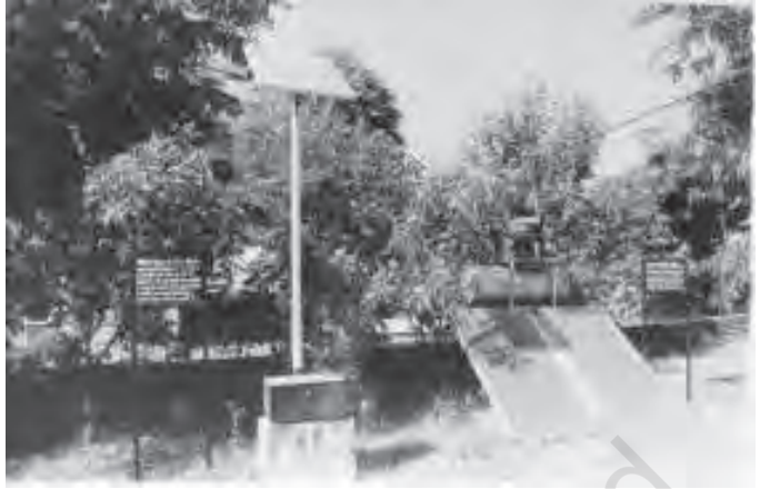
चित्र 8.8 सौर ऊर्जा के लिए बड़ी संभावनाएँ

ऊर्जा के तीन और स्रोत हैं जिन्हें हम आमतौर पर गैर-पारंपरिक स्रोत कहते हैं, वे हैं-सौर ऊर्जा, पवन ऊर्जा और ज्वार ऊर्जा। उष्ण प्रदेश होने के कारण भारत में इन तीनों प्रकार की ऊर्जाओं का उत्पादन करने की असीमित संभावनाएँ हैं। ऐसा तभी संभव होगा जबकि कोई मौजूदा सस्ती प्रौद्योगिकी का उपयोग किया जाये या और भी सस्ती प्रौद्योगिकी विकसित की जाये।