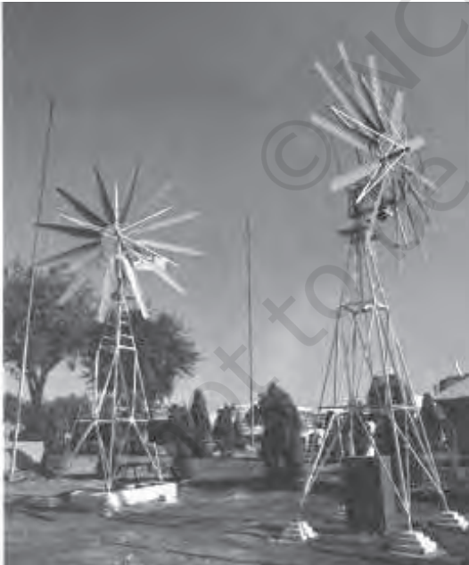
चित्र 8.7 ऊर्जा का अन्य स्रोत पवन चक्की

ऊर्जा के व्यावसायिक और गैर-व्यावसायिक स्रोतों को हम ऊर्जा के पारंपरिक स्रोत कहते हैं।