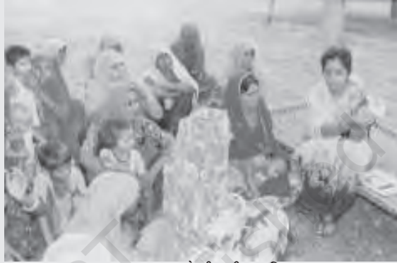
स्वास्थ्य जागरूकता गोष्ठी की प्रगति पर

भारत की स्वास्थ्य आधारिक संरचना और स्वास्थ्य सुविधाओं की तीन स्तरीय व्यवस्था है- प्राथमिक, द्वितीयक और तृतीयक। प्राथमिक क्षेत्रक सुविधाओं में प्रचलित स्वास्थ्य समस्याओं का ज्ञान तथा उन्हें पहचानने, रोकने और नियंत्रित करने की विधि, खाद्य पूर्ति तथा उचित पोषण और जल की पर्याप्त पूर्ति तथा मूलभूत स्वच्छता, शिशु एवं मातृत्व देखभाल, प्रमुख संक्रामक बीमारियों और चोटों से प्रतिरोध तथा मानसिक स्वास्थ्य का संवर्द्धन और आवश्यक दवाओं का प्रावधान शामिल है। ऑक्सीलियरी नर्सिंग मिडवाइफ (ए.एन.एम.) पहला व्यक्ति है, जो ग्रामीण इलाके में प्राथमिक स्वास्थ्य देखभाल प्रदान करता है। प्राथमिक चिकित्सा प्रदान करने के लिए गाँवों तथा छोटे कस्बों में अस्पताल बनाये गये हैं। आमतौर पर यहां एक डॉक्टर, एक नर्स और सीमित मात्रा में दवाएँ उपलब्ध होती हैं। इन्हें प्राथमिक चिकित्सा केंद्र, सामुदायिक चिकित्सा केंद्र और उपकेंद्रों के नाम से जाना जाता है। जब एक रोगी की हालत में प्राथमिक चिकित्सा केंद्र में सुधार नहीं हो पाता, तो उन्हें द्वितीयक या मध्य या उच्च श्रेणी के अस्पतालों में भेजा जाता है। जिन अस्पतालों में शल्य-चिकित्सा, एक्सरे, इ.सी.जी. जैसी बेहतर सुविधाएं होती हैं, उन्हें माध्यमिक चिकित्सा संस्थाएँ कहते हैं। वे प्राथमिक चिकित्सा और बेहतर स्वास्थ्य सुविधाएँ, दोनों ही प्रदान करते हैं। वे प्रायः जिला मुख्यालय और बड़े कस्बों में होते हैं। ऐसे सभी अस्पताल जहाँ उच्च-स्तर के उपकरण और दवाइयाँ उपलब्ध हों और और जो कि ऐसे गंभीर स्वास्थ्य समस्याओं का निपटान करें जिसकी सुविधाएँ प्राथमिक या माध्यमिक अस्पतालों में हो, तृतीयक क्षेत्र में आते हैं।