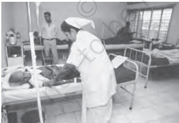
चित्र 8.9 देश के हिस्से में अभी भी स्वास्थ्य आधारिक संरचना का अभाव

वह स्वास्थ्य-शिक्षा, भोजन में मिलावट, दवाएँ तथा जहरीले पदार्थ, चिकित्सा व्यवसाय, जन्म-मृत्यु संबंधी आँकड़े, मानसिक अक्षमता और पागलपन जैसे स्वास्थ्य संबंधित गंभीर मुद्दों को निदेशित व विनियमित करे। केंद्र सरकार, केंद्रीय स्वास्थ्य एवं परिवार कल्याण परिषद् की सहायता से विस्तृत नीतियाँ एवं योजनाएँ