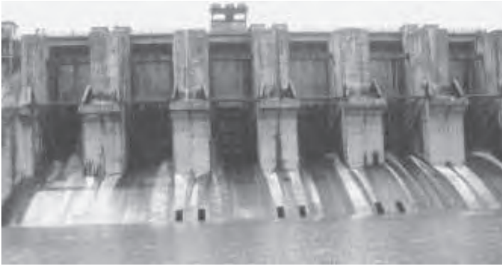
चित्र 8.3 बाँध : विकास के मंदिर