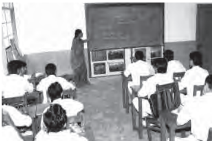
चित्र 8.2 विद्यालय किसी देश की महत्वपूर्ण आधारिक संरचना

व स्वास्थ्य व्यवस्था, सफाई, पेयजल और बैंक, बीमा व अन्य वित्तीय संस्थाएँ तथा मुद्रा प्रणाली शामिल हैं। इनमें से कुछ सुविधाओं का प्रत्यक्ष प्रभाव वस्तुओं और सेवाओं के उत्पादन पर पड़ता है, जबकि कुछ अन्य अर्थव्यवस्था के सामाजिक क्षेत्रों के निर्माण में अप्रत्यक्ष रूप से सहयोग करते हैं।