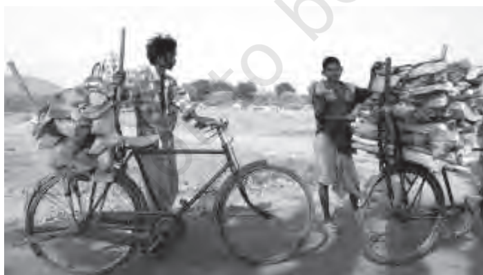
चित्र 8.5 ऊर्जा का महत्वपूर्ण स्रोत ईंधन की लकड़ी

विकास प्रक्रिया में ऊर्जा का एक महत्वपूर्ण स्थान है, साथ ही यह उद्योगों के लिए भी अनिवार्य है। अब इसका कृषि और उससे संबंधित क्षेत्रों जैसे खाद, कीटनाशक और कृषि-उपकरणों के उत्पादन और यातायात में उपयोग भारी स्तर पर हो रहा है। घरों में इसकी आवश्यकता भोजन बनाने, घरों को प्रकाशित करने और गर्म करने के लिए होती है। क्या आप ऊर्जा के बिना किसी उपयोगी वस्तु के उत्पादन या सेवा की कल्पना कर सकते हैं?