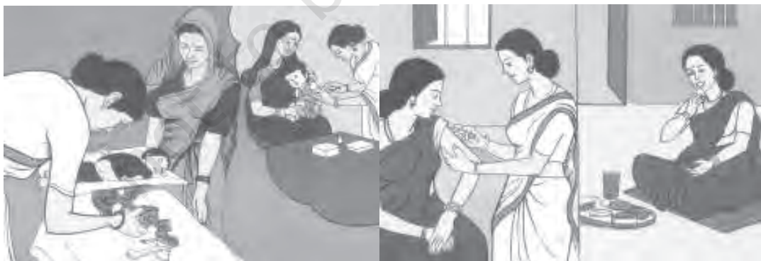
चित्र 8.10 कई प्रकार की चिकित्सा सुविधाओं के बावजूद महिलाओं की चिंताजनक स्थिति

शहरी-ग्रामीण तथा धनी-निर्धन विभाजन: भारत की 70 प्रतिशत जनसंख्या गाँवों में रहती है, लेकिन ग्रामीण इलाकों में भारत के केवल 1/5 अस्पताल (प्राइवेट क्षेत्रक सहित) स्थित हैं। ग्रामीण भारत के पास कुल दवाखानों के