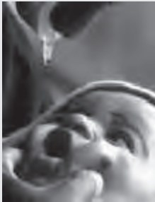
शिशु को पोलियो ड्रॉप दिया जाना

तृतीयक क्षेत्र में ऐसे प्रमुख संस्थान भी शामिल हैं जो कि न केवल उत्तम मेडिकल शिक्षा प्रदान करते और अनुसंधान करते हैं बल्कि वे विशिष्ट स्वास्थ्य सेवाएँ भी प्रदान करते हैं। इनमें से कुछ हैं- मेडिकल इंस्टीट्यूट, नयी दिल्ली, पोस्ट ग्रेजुएट इंस्टीट्यूट, चंडीगढ़; नेशनल इंस्टीट्यूट ऑफ मेंटल हेल्थ और न्यूरो साइंस, बंगलौर और ऑल इंडिया इंस्टीट्यूट ऑफ हाइजीन एंड पब्लिक हेल्थ, कोलकाता।