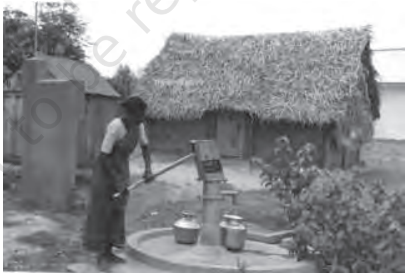
चित्र 8.4 पक्के घर के साथ स्वच्छ पेय जल: अभी भी एक स्वप्न

में आज भी मिट्टी के तेल का उपयोग होता है। ग्रामीण क्षेत्र में लगभग 90 प्रतिशत परिवार खाना बनाने में जैव-ईंधन का इस्तेमाल करते हैं। केवल 24 प्रतिशत ग्रामीण परिवारों में लोगों को नल का पानी उपलब्ध है। लगभग 76 प्रतिशत लोग कुआँ, टैंक, तालाब, झरना, नदी, नहर आदि जैसे पानी के खुले स्रोतों से पानी