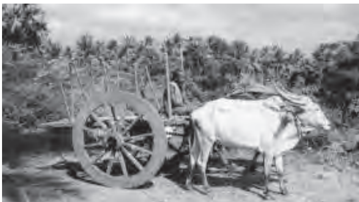
चित्र 8.6 बैलगाड़ी अभी भी ग्रामीण परिवहन बाजार का महत्वपूर्ण माध्यम

हमें ऊर्जा की आवश्यकता क्यों पड़ती है? किन स्वरूपों में यह उपलब्ध है? किसी राष्ट्र की