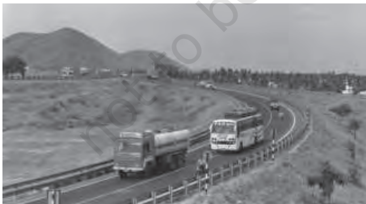
चित्र 8.1 संवृद्धि के मार्गों को जोड़ने वाली सड़कें

यह सब इसीलिए है क्योंकि इन राज्यों में अन्य राज्यों की अपेक्षा उन क्षेत्रों में बेहतर आधारिक संरचना है, जिनमें वे आगे बढ़े हुए हैं।