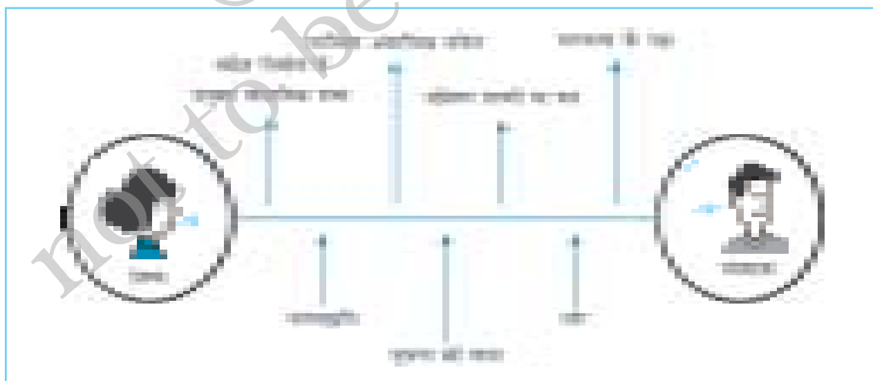
चित्र 9.1 मूल संप्रेषण प्रक्रिया

श्रवण एक महत्वपूर्ण कौशल है जिसका उपयोग हम प्रतिदिन करते हैं। आपकी शैक्षणिक सफलता, नौकरी की उपलब्धि एवं व्यक्तिगत प्रसन्नता काफ़ी हद तक आपके प्रभावी ढंग से सुनने की योग्यता पर निर्भर करती है। प्रथमतया, श्रवण आपको एक निष्क्रिय व्यवहार लग सकता है क्योंकि इसमें चुप्पी होती है लेकिन निष्क्रियता की यह छवि सच्चाई से दूर है। श्रवण में एक प्रकार की ध्यान सक्रियता होती है। सुनने वाले को धैर्यवान तथा अनिर्णयात्मक होने के साथ विश्लेषण करते रहना पड़ता है ताकि सही अनुक्रिया दी जा सके।