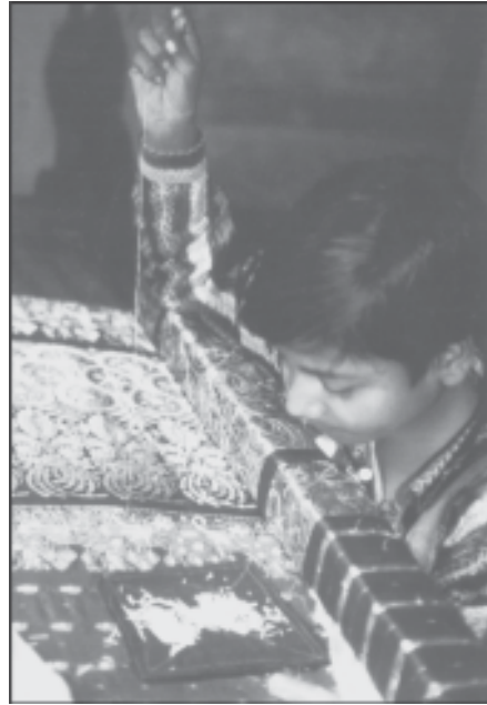
ছবিখনত কি দেখিছা?

অৱশ্যে, দেশখনত বিভিন্ন কাৰণত অনেকখিনি ল'ৰা-ছোৱালী শিক্ষা লাভৰ পৰা বঞ্চিত হৈ ৰয়। সাধাৰণতে দেখা যায় যে খেতিৰ দিনত অনুসূচিত জাতি-জনজাতিৰ অনেকখিনি ল'ৰা-ছোৱালীকে বিদ্যালয়লৈ পঠিওৱাৰ পৰিৱৰ্তে খেতি-পথাৰলৈহে অভিভাৱকসকলে লৈ যায়। আকৌ, সেই শ্ৰেণীসমূহৰ কন্যা-সন্তানসকলক সাধাৰণতে পাকঘৰত ৰন্ধা-বঢ়াৰ কামতে ব্যস্ত কৰি ৰখাৰ বাবে তেওঁলোক শিক্ষা-দীক্ষাৰ পৰা সমূলক্ষেপে বঞ্চিত হৈ ৰয়।