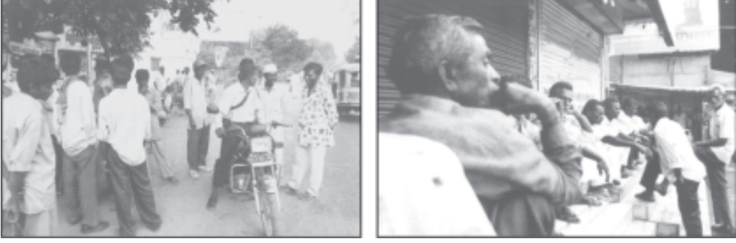
ফটোত দেখা সমূহবোৰ কেনেধৰণৰ

(খ) সমাজভেদে প্ৰচলিত থকা সামাজিক সমূহবোৰৰ ভিন্ন প্ৰকৃতিৰ।