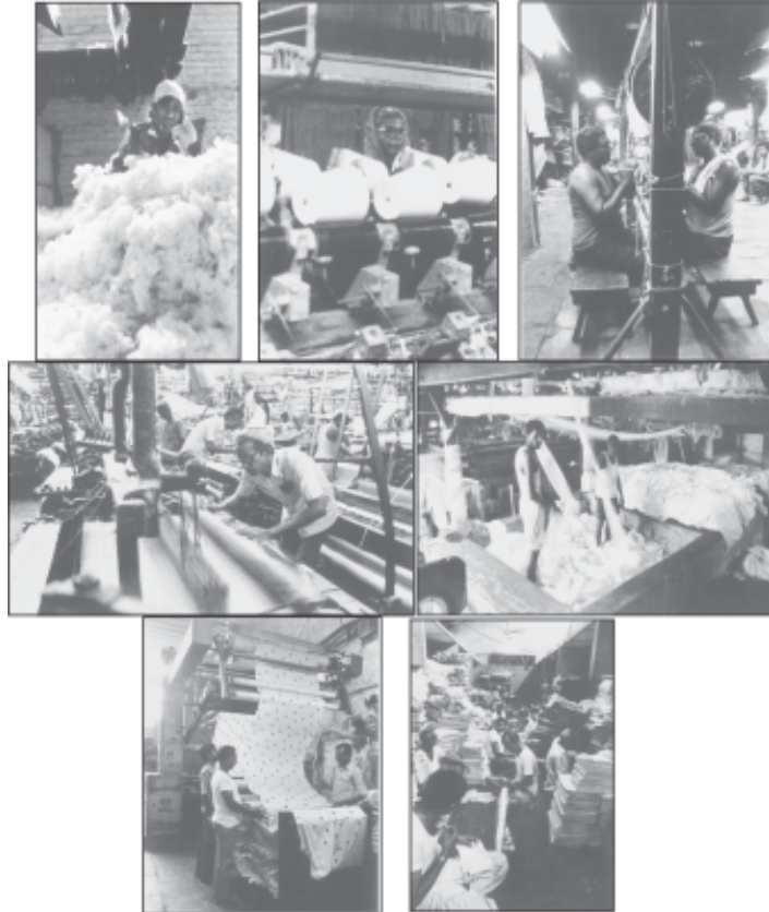
ছবি চাই দুই প্ৰকাৰৰ বস্ত্ৰ উদ্যোগৰ আলোচনা কৰা

এই বিষয়ে সহজকৈ বুজিবৰ বাবে বাংগালোৰৰ বস্ত্ৰ উদ্যোগটোৰ বিষয়ে কিছু কথা আলোচনা কৰিব পাৰি।