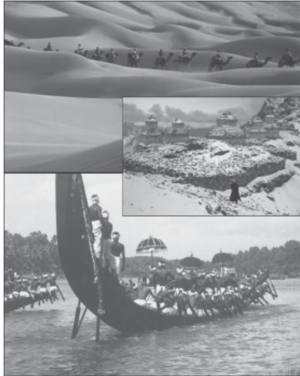
প্ৰাকৃতিক পৰিবেশে কিদৰে সংস্কৃতিক প্ৰভাৱিত কৰে আলোচনা কৰি চোৱাচোন।

ইয়াৰ বিপৰীতে প্ৰাকৃতিক প্ৰত্যাহ্বানৰ সন্মুখীন হ'ব পৰাকৈ কোনটো সংস্কৃতি উপযোগী বা অনুপযোগী সেইটোক নিৰ্ধাৰণ কৰিব লাগে।