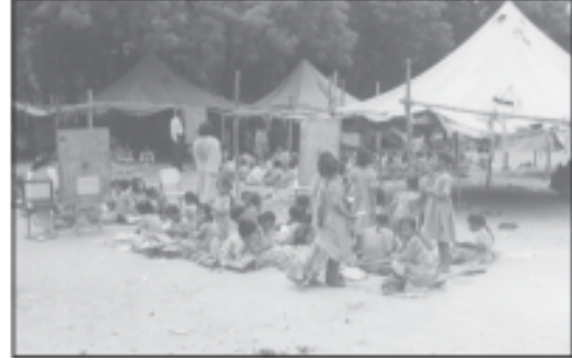
ছবিত দেখা দুই প্ৰকাৰৰ স্কুল সম্পৰ্কে আলোচনা কৰা

অৱশ্যে, দেশখনত বিভিন্ন কাৰণত অনেকখিনি ল'ৰা-ছোৱালী শিক্ষা লাভৰ পৰা বঞ্চিত হৈ ৰয়। সাধাৰণতে দেখা যায় যে খেতিৰ দিনত অনুসূচিত জাতি-জনজাতিৰ অনেকখিনি ল'ৰা-ছোৱালীকে বিদ্যালয়লৈ পঠিওৱাৰ পৰিৱৰ্তে খেতি-পথাৰলৈহে অভিভাৱকসকলে লৈ যায়। আকৌ, সেই শ্ৰেণীসমূহৰ কন্যা-সন্তানসকলক সাধাৰণতে পাকঘৰত ৰন্ধা-বঢ়াৰ কামতে ব্যস্ত কৰি ৰখাৰ বাবে তেওঁলোক শিক্ষা-দীক্ষাৰ পৰা সমূলক্ষেপে বঞ্চিত হৈ ৰয়।