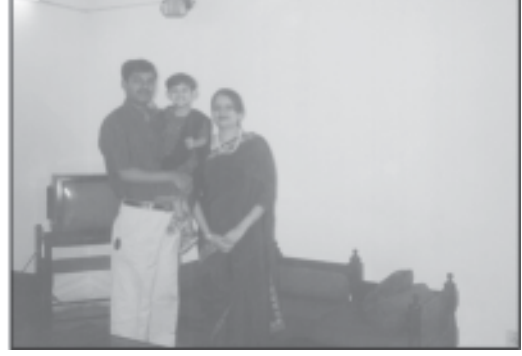
পৰিয়াল আৰু বাসস্থানৰ পাৰ্থক্য লক্ষ্য কৰা