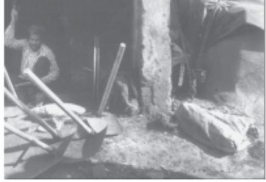
কাম আৰু ঘৰ