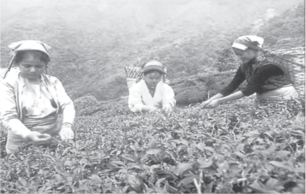
চাহ বাগিচাত পাত টোকাৰ দৃশ্য

পৰিৱৰ্তনৰ লগে লগে এইবিলাকৰো পৰিৱৰ্তন হৈছিল। আমি যিসকল লোকক থলুৱা (Native) বুলি ধৰি লওঁ, তেওঁলোক ভাৰতীয় বা চুডানিজ (Sudanese) বা নগা বা চাওতাল (Santhals) হ'ব পাৰে। এই সকল লোকে নিজৰ সমাজখনৰ সম্পৰ্কে ক'ব বা লিখিব পাৰে। অতীতৰ সম্পৰ্কে তথ্য আগবঢ়োৱা নৃতত্ত্ববিদ সকলে নিৰপেক্ষ, বিজ্ঞানসন্মত আৰ্হিত সৰল সমাজৰ বিৱৰণ দাঙি ধৰিছে। বাস্তৱিকতে সেই সমাজ বিলাকৰ ওপৰত পশ্চিমীয়া আধুনিক সমাজৰ আৰ্হি স্বৰূপে ধাৰাবাহিকভাৱে তুলনামূলক অধ্যয়ন কৰিছিল।