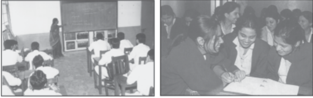
দুটা ব্যতিক্ৰমী সমূহ

অৰ্থাৎ “মানুহৰ মানৱীয় প্ৰকৃতি জন্মৰ লগতে গঢ় লৈ নুঠে, মানুহৰ সংস্পৰ্শতহে ই গঢ় লৈ উঠে বা আয়ত্ব কৰিবলৈ সক্ষম হয়। জন্মৰ লগে লগে শিশু এটা প্ৰাথমিক সমূহৰ সংস্পৰ্শলৈ আহে আৰু মানৱ প্ৰকৃতি বিকাশত প্ৰাথমিক সমূহে অৰিহণা যোগায়।”