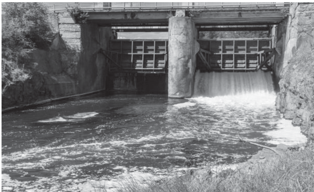
চিত্র : এটা সৰু নদী বান্ধ (A small dam)