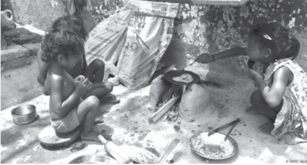
চিত্ৰ : কনিষ্ঠ ভাই-ভনীৰ চোৱাচিতাৰ দায়িত্ব পালনত এজনী বালিকা (A girl child looking after the sibling)

নগৰ আৰু মহানগৰৰ সামাজিক শৃংখলাৰ বেছিভাগ গুৰুত্বপূৰ্ণ বিষয় আৰু সমস্যা ঠাইৰ পৰিমাণৰ সৈতে জড়িত। জনসংখ্যাৰ উচ্চ ঘনত্বই ঠাইডোখৰক অত্যধিক গুৰুত্ব দিয়ে আৰু বিতৰণৰ অতি জটিল সমস্যাৰ সৃষ্টি কৰে। মহানগৰৰ প্ৰসাৰ বিকাশক্ষম কৰাৰ নিশ্চয়তা নগৰীয়া সামাজিক শৃংখলাৰ প্ৰাথমিক নিৰূপিত কাম। ইয়াৰ অৰ্থ হৈছে কিছুমান ব্যক্তিৰ সংগঠন আৰু ব্যৱস্থাপনা, যেনে— গৃহ আৰু আৱাসিক আৰ্হি, বৃহৎ সংখ্যক কৰ্মচাৰীক কৰ্মস্থললৈ অহা-যোৱাৰ বাবে জন-পৰিবহণ ব্যৱস্থা, আৱাসিক, চৰকাৰী আৰু ঔদ্যোগিক খণ্ডৰ ভূমি ব্যৱহাৰৰ ক্ষেত্ৰত সহায়স্থানৰ ব্যৱস্থা আৰু শেষত জনস্বাস্থ্য, অনাময় ব্যৱস্থা, আৰক্ষী, জনসুৰক্ষা আৰু নগৰ পৰিচালনাৰ আৱশ্যকতাবোৰ নিৰীক্ষণ কৰা। এই কাৰ্যবোৰৰ প্ৰত্যকটোৱেই পৰিকল্পনাৰ ৰূপায়ণ আৰু তদাৰক কৰাৰ অতি কঠিন প্ৰত্যাহ্বানৰ সন্মুখীন হোৱা গুৰু দায়িত্ব বহন কৰে। এই সকলোবোৰ কাৰ্য অধিক জটিল হৈ উঠে যেতিয়া শ্ৰেণী, নৃগোষ্ঠীয়তা, ধৰ্ম, জাতি আদি বিভাজন আৰু অস্থিৰতাৰ পৰিস্থিতিবোৰ সক্ৰিয় ৰূপত বিৰাজ কৰে।