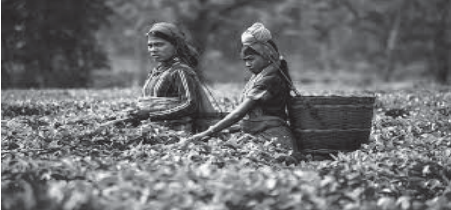
চিত্ৰ : চাহ বাগানত কৰ্মৰত মহিলা (Women at work in Tea garden)