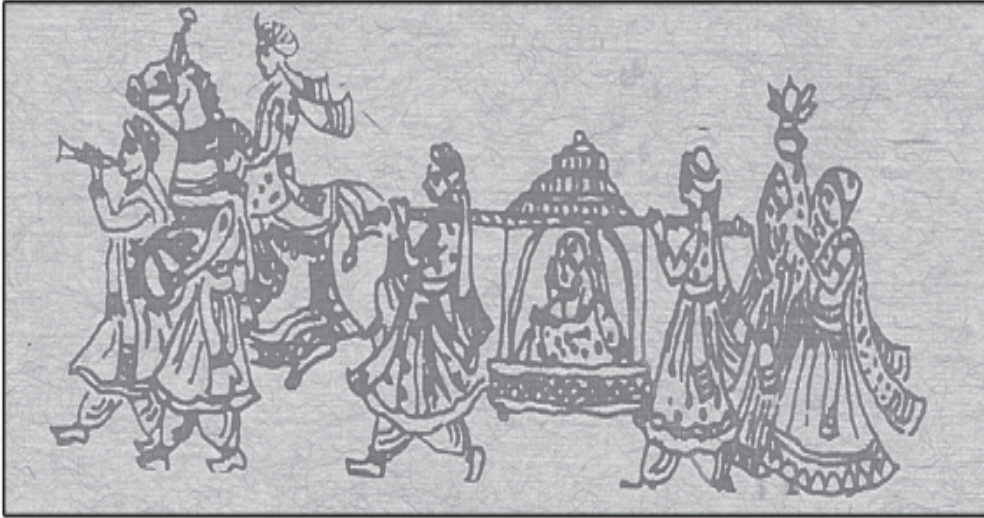
চিত্ৰ : দোলাত কইনা দৰাৰ ঘৰলৈ যোৱাৰ দৃশ্য (Bride leaving for groom's house in a 'Doli')

সহযোগিতা কেনেদৰে সংঘৰ্ষৰ লগত জড়িত বুজি পাবৰ বাবে আমি বল প্ৰয়োগ (Enforced) কৰি কৰা সহযোগিতা আৰু স্বইচ্ছা (Voluntary) কৰা সহযোগিতাৰ পাৰ্থক্য বুজি পাব লাগিব। এইটো বুজি পাবৰ বাবে আমি সম্পত্তিৰ অধিকাৰৰ ক্ষেত্ৰত নাৰীৰ জন্মগত পৰিয়ালৰ লগত হোৱা সমস্যাৰ কথা ক'ব পাৰোঁ। জন্মসূত্ৰে পৈতৃক সম্পত্তি লাভ কৰাৰ মনোবৃত্তিৰ সন্দৰ্ভত সমাজৰ বিভিন্ন গোটক লৈ এটি অধ্যয়ন কৰা হৈছিল। পৰিমাণগতভাৱে এটা ডাঙৰ মহিলাৰ গোট (41.7%) সম্পত্তিৰ অধিকাৰ সন্দৰ্ভত নিজৰ জীয়েকৰ মৰম আৰু জীয়েকৰ কাৰণে থকা মৰমৰ কথা কয়। তেওঁলোকে পৈতৃক সম্পত্তি সম্পূৰ্ণ বা আংশিকভাৱে নিবিচাৰে। কাৰণ তেওঁলোকে ভয় কৰে যে এনে কৰিলে ককাই-ভাইৰ পৰা আৰু ভাই-বোৱাৰীৰ পৰা ঘৃণাৰ পাত্ৰী হ'ব। যাৰ ফলশ্ৰুতিত নাৰী গৰাকীক হয়তো পৈতৃক ঘৰৰ মানুহে আদৰেৰে আকোৱালি নল'ব। সেয়েহে হয়তো মহিলাসকলে সম্পত্তিৰ অধিকাৰ নিবিচাৰে। যি মহিলাই পৈতৃক সম্পত্তি বিচাৰে তেওঁক লুভীয়া (Greedy shrew) বুলি নামকৰণ কৰে। সেইবাবে পৈতৃক গৃহৰ লগত সম্পৰ্ক ৰাখি তেওঁলোকৰ সমৃদ্ধি আৰু সংকটৰ সমভাগী হ'বলৈ মহিলাসকলে সম্পত্তিৰ অধিকাৰ নিবিচাৰে।