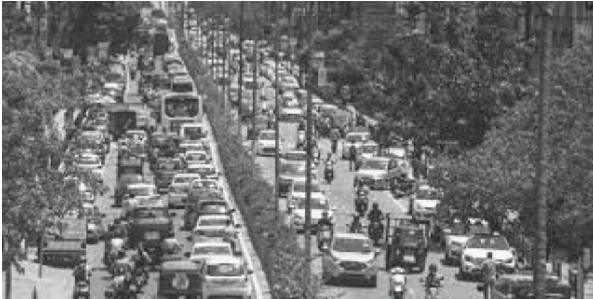
চিত্ৰ : বিভিন্ন প্ৰকাৰৰ যান-বাহনেৰে এক নগৰীয়া অঞ্চল (Various kinds of transport in an urban area)

মহানগৰত মানুহ ক'ত আৰু কেনেকৈ বাস কৰিব এই প্ৰশ্নটো সামাজিক-সাংস্কৃতিক পৰিচয়ৰ ওপৰত আধাৰিত হয়। সমগ্ৰ বিশ্বত মহানগৰবোৰৰ আৱাসিক অঞ্চলবোৰ প্ৰায়েই শ্ৰেণী, প্ৰজাতি, নৃগোষ্ঠী, ধৰ্ম আৰু অন্যান্য কাৰকৰ দ্বাৰা বিভাজিত হৈ আহিছে। এন পৰিচয়বোৰৰ মাজত থকা মানসিক অস্থিৰতাই পৃথকীকৰণৰ কাম কৰে আৰু তাৰ ফলাফলো পৰিলক্ষিত হয়। উদাহৰণস্বৰূপে, ভাৰতত ধৰ্মীয় সম্প্ৰদায়বোৰৰ মাজত থকা সাম্প্ৰদায়িক উত্তেজনা, বিশেষকৈ হিন্দু আৰু মুছলমানৰ সাম্প্ৰদায়িক উত্তেজনাৰ পৰিণামস্বৰূপে মিশ্ৰিত প্ৰতিবেশী অঞ্চল একক-সম্প্ৰদায় অঞ্চললৈ ৰূপান্তৰিত হৈছে। ফলস্বৰূপে, উদ্গীৰণৰ লগে লগেই সাম্প্ৰদায়িক হিংসাই মুহূৰ্ততে বিস্তৃতি লাভ কৰে, যিটোৱে আকৌ 'ঘেটোকৰণ' (Ghettoisation) প্ৰক্ৰিয়াক উদগনি জনায়। ভাৰতৰ বহু মহানগৰত এনে হোৱা দেখা গৈছে। শেহতীয়াভাৱে ২০০২ চনৰ হিংসাত্মক ঘটনাবোৰৰ পিছতেই গুজৰাটত এই প্ৰক্ৰিয়া পৰিলক্ষিত হৈছিল। বিশ্বব্যাপী 'গেটেড সম্প্ৰদায়' (Gated communities) নামেৰে পৰিচিত সম্প্ৰদায় ভাৰতীয় মহানগৰবোৰতো পোৱা যায়। গেটেড সম্প্ৰদায় শব্দটোৱে চৌপাশৰ পৰিৱেশৰ পৰা পৃথক কৰা বেৰ আৰু প্ৰৱেশদ্বাৰে আবৃত এক সমৃদ্ধ চুবুৰীক বুজায়, য'ত প্ৰৱেশ আৰু প্ৰস্থানৰ নিয়ন্ত্ৰণৰ ব্যৱস্থা ৰখা হয়। অধিকাংশ এনে ধৰণৰ সম্প্ৰদায়ৰ নাগৰিকৰ বাবে সা-সুবিধা, যেনে— পানী আৰু বিদ্যুৎ যোগান, আৰক্ষী আৰু নিৰাপত্তাৰ নিজস্ব সমান্তৰাল ব্যৱস্থা থাকে।