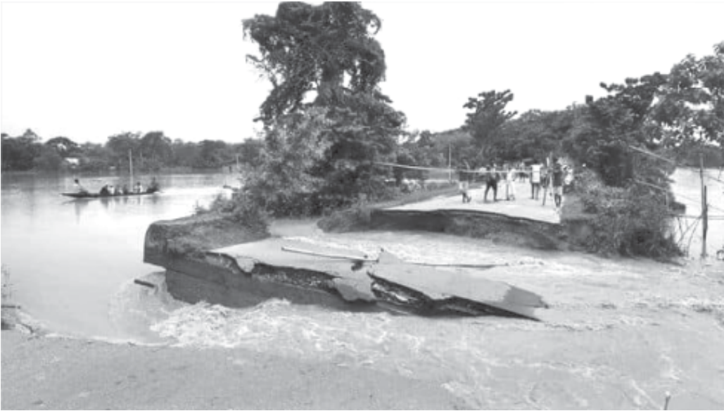
চিত্ৰ : প্ৰলয়ংকাৰী বানে সৃষ্টি কৰা গাঁত (The earth caves in after heavy floods)

প্ৰকৃতি, পাৰিপাৰ্শ্বিকতা আৰু প্ৰাকৃতিক পৰিবেশে সমাজ গঠনত গুৰুত্বপূৰ্ণ প্ৰভাৱ পেলায়। সেই হিচাপে পৰিবেশৰ পৰিৱৰ্তনে সামাজিক পৰিৱৰ্তনত প্ৰভাৱ পেলোৱাতো স্বাভাৱিক। এইটো স্বীকাৰ কৰিব লাগিব যে, অতীতত মানুহে প্ৰকৃতিজনিত ক্ৰিয়া-কলাপবোৰ নিয়ন্ত্ৰণ কৰিব পৰা নাছিল। উদাহৰণস্বৰূপে— মৰুভূমিৰ পৰিবেশত বাস কৰা মানুহে নদী উপত্যকাত বাস কৰা মানুহৰ দৰে শস্যৰ উৎপাদনৰ অৰ্থে কৃষি কৰ্ম কৰিব নোৱাৰিছিল। গতিকে মৰুভূমি অঞ্চলৰ মানুহৰ খাদ্য অভ্যাস, পোছাক-পৰিচ্ছদ, জীৱিকা নিৰ্বাহৰ উপায়, সামাজিক আন্তঃক্ৰিয়াৰ ধৰণ আদি নিৰ্ভৰ কৰিছিল তেওঁলোকৰ পৰিবেশ আৰু জলবায়ুৰ ওপৰত। সেইদৰে, অতি ঠাণ্ডা অঞ্চলত বাস কৰা লোকসকল বা সমুদ্ৰৰ পাৰ্শ্বৱৰ্তী অঞ্চলৰ নগৰ চহৰত বাস কৰা লোকসকল অথবা গিৰিপথ বা সাৰুৱা নদী-উপত্যকাত বাস কৰা লোকসকলৰ জীৱন ধাৰণৰ ক্ষেত্ৰতো এনে বৈশিষ্ট্য পৰিলক্ষিত হয়। কিন্তু পূৰ্বতে পৰিবেশে সমাজৰ ওপৰত যিমান প্ৰভাৱ পেলাইছিল, সময় আগবঢ়াৰ লগে লগে বিজ্ঞান প্ৰযুক্তিৰ উন্নতিৰ ফলত তাৰ প্ৰভাৱ ক্ৰমান্বয়ে হ্রাস পাবলৈ ধৰিছে। প্ৰযুক্তিবিদ্যাই প্ৰকৃতিৰ পৰা অহা দুৰ্যোগ বা সমস্যা প্ৰতিৰোধ কৰি সেইবোৰৰ সৈতে খাপ খাই বসবাসৰ উপযোগী কৰি তুলিছে। ফলত বিভিন্ন সামাজিক পৰিবেশত বাস কৰা লোকসকলৰ মাজত থকা পাৰ্থক্য হ্রাস পাইছে। আনহাতে, প্ৰযুক্তিবিদ্যাই প্ৰকৃতি আৰু ইয়াৰ সৈতে থকা মানুহৰ সম্বন্ধৰো পৰিৱৰ্তন সাধন কৰিছে। ইয়াৰ লগে লগে সমাজৰ ওপৰত প্ৰকৃতিৰ প্ৰভাৱো সলনি হৈ আহিছে।