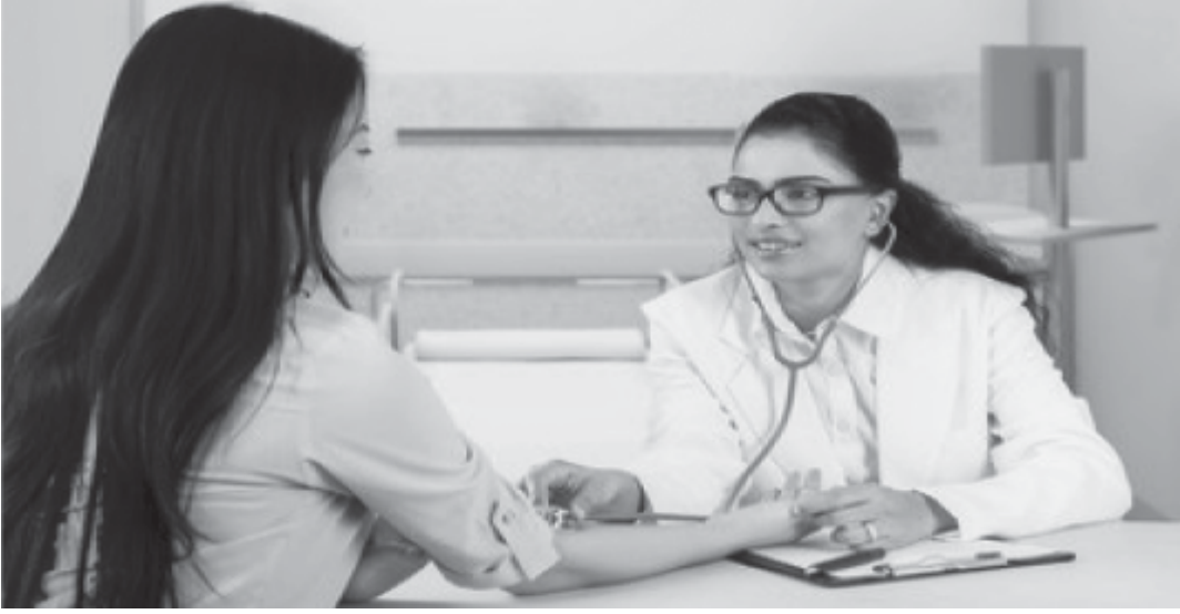
চিত্ৰ : ৰোগী পৰীক্ষা কৰি থকা অৱস্থাত এগৰাকী চিকিৎসক (A doctor checking a patient)

আৰু ইতিহাসত জন ৰাজনীতিৰ স্থল হিচাপে ইয়াক জনা যায়, তথাপি মহানগৰবোৰ আধুনিক ব্যক্তিৰ কৰ্মক্ষেত্ৰ বুলিও বিবেচিত হয়। নামবিহীনতা, সুযোগ-সুবিধা আৰু সংস্থাৰ সংযোজন কেৱল বৃহৎ জনসংখ্যাৰ মাজতহে সম্ভৱ হয় আৰু মহানগৰে ব্যক্তিক অবাধ সম্ভাৱনা পূৰণ কৰাত সহায় কৰে। গাঁৱত ব্যক্তিকেन्द्रিকতাক নিৰুৎসাহিত কৰা হয় আৰু সীমিত সুবিধা থাকে। তাৰ বিপৰীতে মহানগৰে ব্যক্তিক প্ৰতিপালন কৰে।