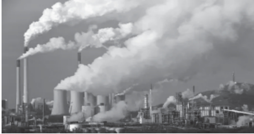
চিত্ৰ : ঔদ্যোগিক প্ৰদূষণ (Industrial pollution)

বিভিন্ন উদ্যোগ যেনে— তেল শোধনাগাৰ, চিমেণ্ট উদ্যোগ, চামৰাৰ উদ্যোগ, ৰং প্ৰস্তুতকৰণ উদ্যোগ, ৰাসায়নিক সাৰ কাৰখানা, তাপ বিদ্যুৎ প্ৰকল্প ইত্যাদিৰ পৰা নিৰ্গত ভিন্ন গেছে বায়ু দূষিত কৰি মানুহৰ স্বাস্থ্যৰ প্ৰতি ভাবুকি আনি ভিন্ন ধৰণৰ অসুখৰ সৃষ্টি কৰে। আকৌ যান-বাহনত পেট্ৰ'ল, ডিজেল দহন কৰাৰ ফলত, ভিন্ন কাৰণত পৰ্যাপ্ত পৰিমাণৰ গাড়ীৰ টায়াৰ জ্বলোৱাৰ ফলত অধিক পৰিমাণৰ কাৰ্বন-ডাই-অক্সাইড, কাৰ্বন-মনক্সাইড আদি উৎপন্ন হয়, যি বায়ু প্ৰদূষণ কৰি মানৱ সমাজলৈ বিপদ কঢ়িয়াই আনে। এনে ধৰণেৰে বায়ু প্ৰদূষণ হোৱাৰ ফলশ্ৰুতিত মানুহৰ মূৰৰ বিষ, ছালৰ ৰোগ, হৃদযন্ত্ৰৰ সমস্যা, স্নায়ুতন্ত্ৰৰ সমস্যা আদিৰ সৃষ্টি হয়।