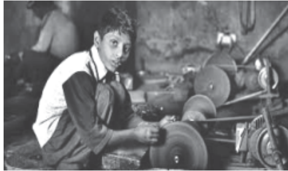
চিত্ৰ : কৌশলী কৰ্মত ব্যস্ত এটি শিশু (A child doing skilled work)