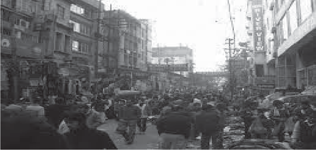
চিত্ৰ : মহানগৰৰ এক ব্যৱসায়িক কেন্দ্ৰ ( A commercial centre in a city)

নিৰ্মাণত প্লাষ্টিকৰ চাদৰ আৰু ডাঠ কাগজৰ পৰা আৰম্ভ কৰি বহুমহলীয়া গৃহত ব্যৱহাৰ হোৱা কংক্ৰীটৰ গাঁথনি ব্যৱহাৰ হয়। অন্য স্থানত থকাৰ দৰে স্থায়ী সম্পত্তিৰ অধিকাৰ নথকাৰ বাবে বস্তি অঞ্চলত 'দাদাসকল' আৰু শক্তিশালীলোকৰ উদ্ভৱ হয়, যিসকলে বস্তিৰ বাসিন্দাসকলৰ ওপৰত কৰ্তৃত্ব বলবৎ কৰে। বস্তি অঞ্চলত থকা নিয়ন্ত্ৰণে স্বাভাৱিকভাৱেই বেআইনী কাৰ্যকলাপত লিপ্ত অপৰাধী আৰু ভূ-সম্পত্তিৰ সৈতে জড়িত অপৰাধী দলক সহায় কৰে।