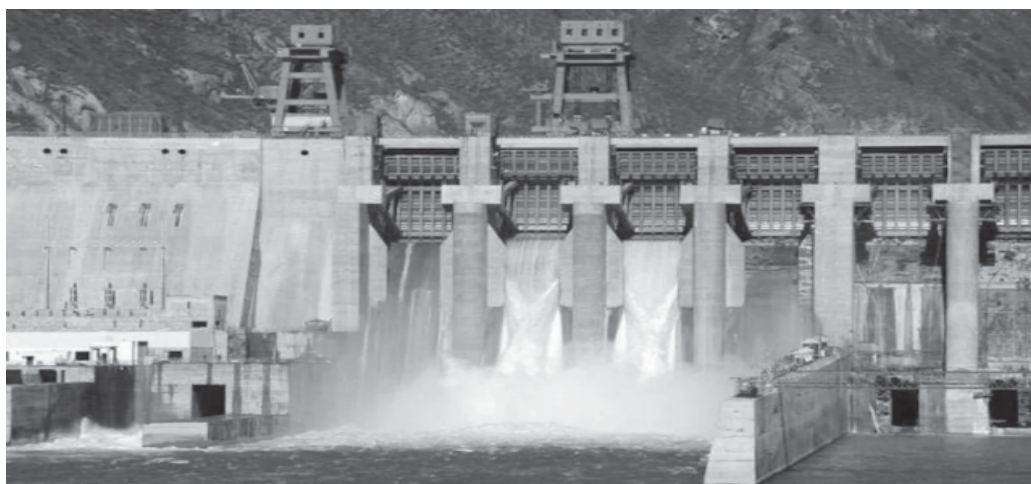
চিত্র : এটা বৃহৎ নদী বান্ধ (A big dam)