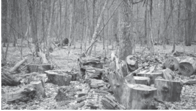
চিত্ৰ : নিৰ্বনানীকৰণ (Deforestation)