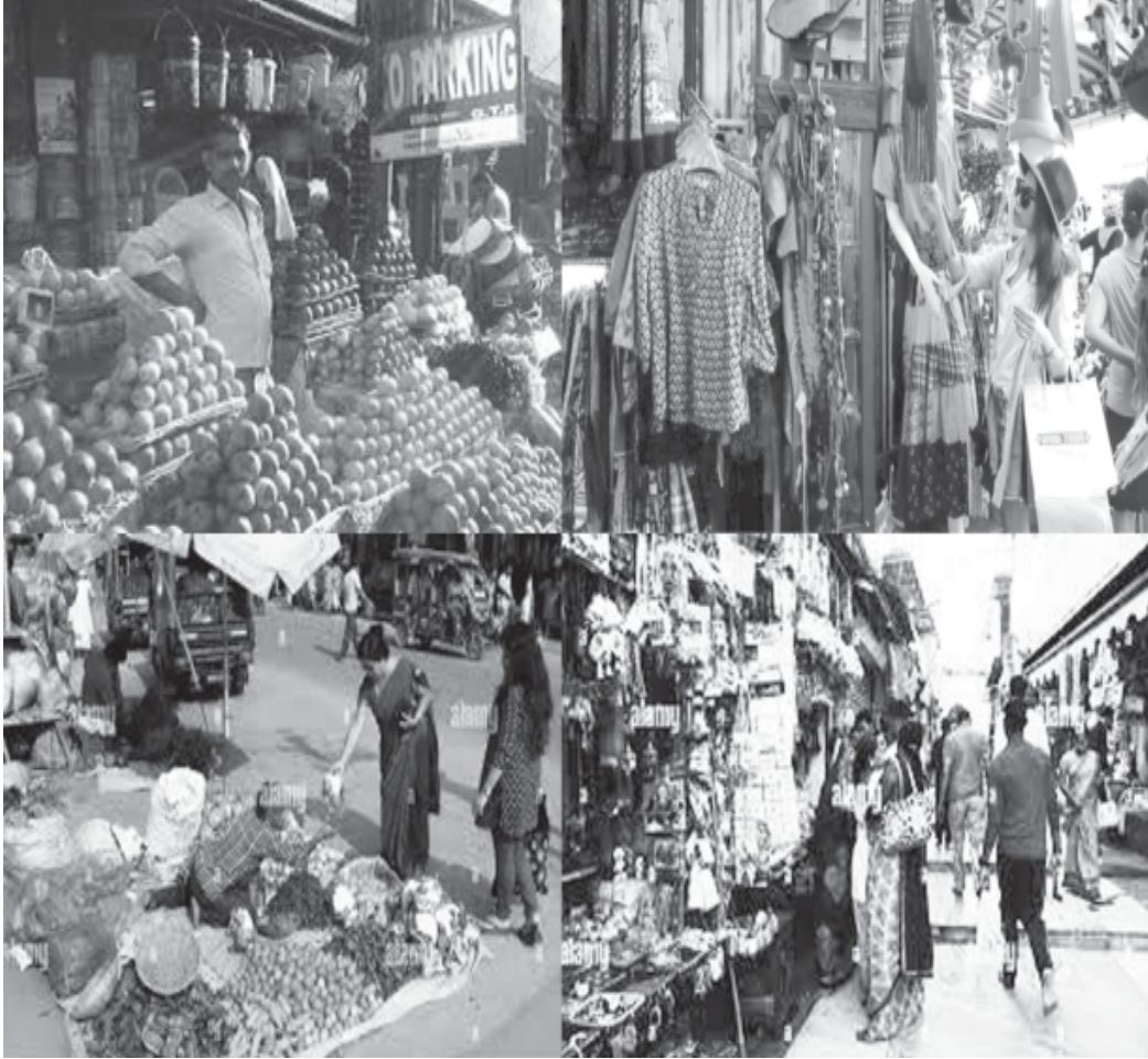
মহানগৰৰ বজাৰ এলেকাৰ আলোকচিত্ৰ (Shopping in a city)

প্রতিদিন নিয়মিতভাৱে ঘৰৰ পৰা কৰ্মক্ষেত্ৰলৈ অহা-যোৱা কৰা দূৰণিবটীয়া লোকসকল (Commuters) এক প্ৰভাৱশালী ৰাজনৈতিক নিৰ্বাচন সমষ্টি হৈ পৰে আৰু কেতিয়াবা বিস্তাৰিত উপসংস্কৃতি বিকশিত কৰে। উদাহৰণস্বৰূপে, মুম্বাইৰ উপ-নগৰীয় ৰেলত যাত্ৰীসকলৰ মাজত বহুতো অনানুষ্ঠানিক সম্পৰ্কই গঢ় লয়। অসমৰো স্থানীয় যাত্ৰীবাহী ৰেলত প্ৰতিদিনে একেলগে যাত্ৰা কৰা লোকৰ মাজত গীত গোৱা, উৎসৱ-পালন, পাচলি কটা, লুডু, তাচপাত আৰু বোৰ্ডত খেলা বিভিন্ন খেল অথবা সাধাৰণভাৱে সমাজিকীকৰণ প্ৰক্ৰিয়া দেখা যায়।