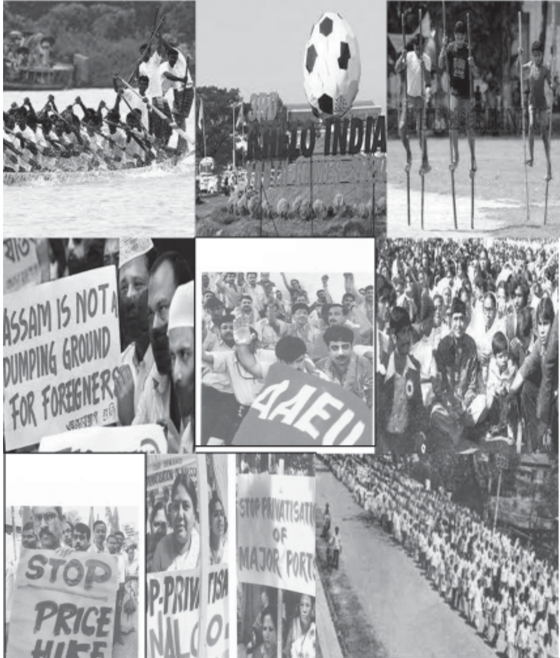
চিত্র : বিভিন্ন প্রকারৰ প্ৰক্ৰিয়া (Different types of processes)