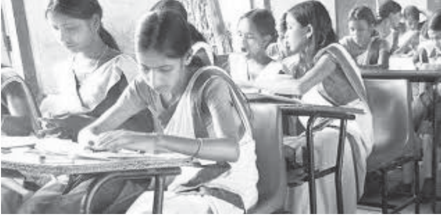
চিত্ৰ :শ্ৰেণীকোঠাত ছাত্ৰ-ছাত্ৰী (Students in classroom)

মন কৰিবলগীয়া যে, সামাজিক পৰিৱৰ্তনৰ বিভিন্ন ধৰণ আৰু কাৰণ বিভিন্ন সময়ত লক্ষ্য কৰা যায়। সামাজিক পৰিৱৰ্তনৰ ধৰণ বুলি কওঁতে ইয়াৰ বিভিন্ন প্ৰকাৰ বা শ্ৰেণীৰ কথা বুজোৱা হৈছে। উল্লেখযোগ্য যে, সামাজিক পৰিৱৰ্তনৰ শ্ৰেণীকৰণ প্ৰধানকৈ দুটা আধাৰত কৰা হয়। যেনে—সামাজিক পৰিৱৰ্তনৰ কাৰণ আৰু পৰিৱৰ্তনৰ উৎস। কেতিয়াবা এনে কাৰণবোৰ আভ্যন্তৰীণ (Endogenous) আৰু বাহ্যিক (Exogenous) ৰূপে শ্ৰেণীকৰণ কৰি লোৱা হয়। সামাজিক পৰিৱৰ্তনৰ কাৰক বা উৎসবোৰক প্ৰধানকৈ পাঁচটা ভাগত ভাগ কৰি আলোচনা কৰিব পাৰি। সেইকেইটা হ'ল পৰিবেশজনিত (Environmental), প্ৰযুক্তিগত (Technological), আৰ্থিক (Economic), ৰাজনৈতিক (Political) আৰু সাংস্কৃতিক (Cultural)।