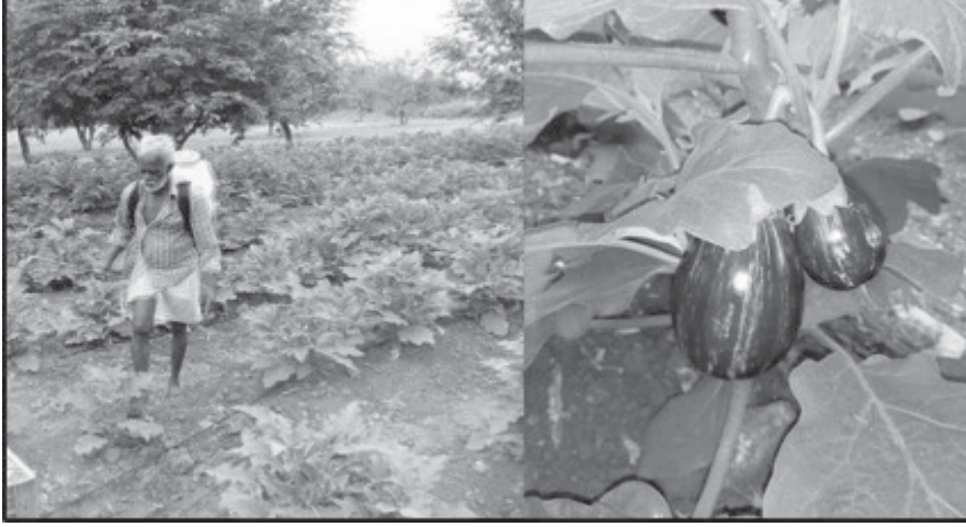
চিত্ৰ : বেঙেনাৰ বাগিছাত বীজাণুনাশক দ্ৰব্য প্ৰয়োগ (Spraying pesticide in a brinjal field)

আন এক পৰিৱেশ প্ৰদূষণ হ'ল জল প্ৰদূষণ। ইয়াৰ ফলশ্ৰুতিত পৃথিৱীৰ এক অংশ লোকে বিশুদ্ধ পানীৰ সংকটত পৰিবলগীয়া হৈছে। এই জল প্ৰদূষণৰ মুখ্য উৎসবোৰৰ ভিতৰত কেৱল ঘৰুৱা নলা-নৰ্দমাই আৰু কাৰখানাৰ পৰা সৃষ্টি হোৱা বৰ্জনীয়া পদাৰ্থবোৰেই নহয়, খেতি পথাৰত ব্যৱহাৰ কৰা কৃত্ৰিম সাৰ, কীটনাশক দ্ৰব্যইও পানী প্ৰদূষিত কৰে। জলপ্ৰদূষণৰ মূল কাৰকবোৰ হ'ল ভূ-গৰ্ভৰ পানীত মিহলি হৈ থকা ফ্ল'ৰাইড, আৰ্চেনিক ইত্যাদি যৌগবোৰ, ভিন্নধৰণৰ উদ্যোগৰ পৰা সৃষ্টি হোৱা বৰ্জিত পদাৰ্থ, অবিজ্ঞানসন্মত নলা-নৰ্দমাৰে সঠিক স্থানলৈ পঠাব নোৱাৰা, নগৰ-চহৰত উৎপন্ন হোৱা বৰ্জিত পদাৰ্থ, বানপানীৰ প্ৰদূষিত পানী দৈনন্দিন জীৱনত ব্যৱহাৰ কৰা পানীৰ উৎসত মিহলি হোৱা ইত্যাদি কাৰকৰ ফলত পানী প্ৰদূষিত হয়। নদী আৰু জলবায়ুৰ প্ৰদূষণ বিশেষকৈ এটি মুখ্য সমস্যা হৈ পৰিছে।